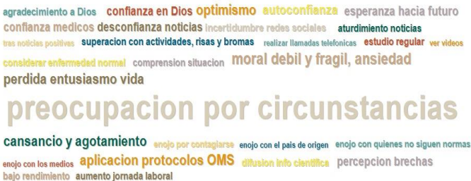
Grafico 2. Nube de Palabras de los Códigos Asociados a temas