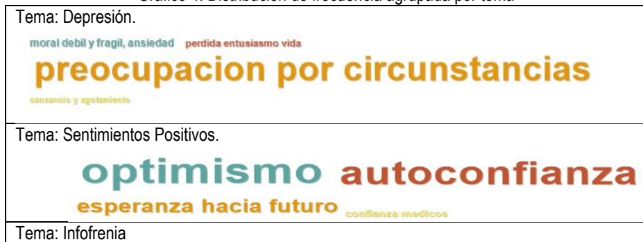
Gráfico 4. Distribución de frecuencia agrupada por tema

Para el caso de Graficar la Nube de palabras referida a los códigos asociados a cada tema por separado se obtuvo lo expresado en el grafico 4, en este gráfico se observa la distribución de frecuencia de ocurrencias de cada código agrupadas por Tema, el tamaño de cada palabra representa cualitativamente la ocurrencia y es relativa al tema específico: