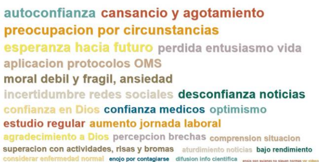
Gráfico 3. Nube de palabras referidos a los códigos por número de Entrevistas.