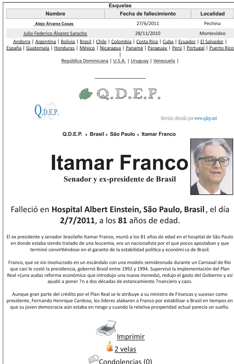
Fig. 3. La web de “Q.D.E.P” ofrece una información más amplia de la persona fallecida, como en el caso del Expresidente brasileño Itamar Franco