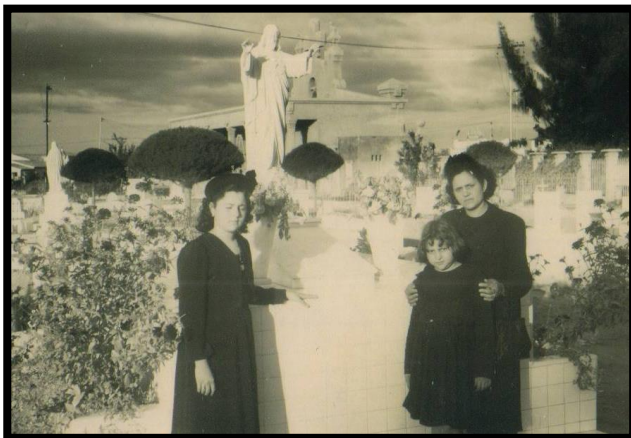
Visita Luctuosa al Cementerio El Redondo de Maracaibo Maracaibo, cerca de 1950.