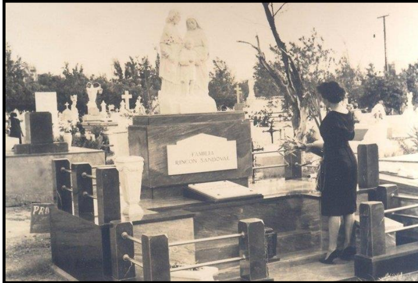
Visita a la Tumba Paterna. Maracaibo, cerca de 1950.