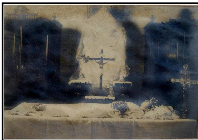
Joven perteneciente a la Familia Paris Maracaibo, cerca de 1930