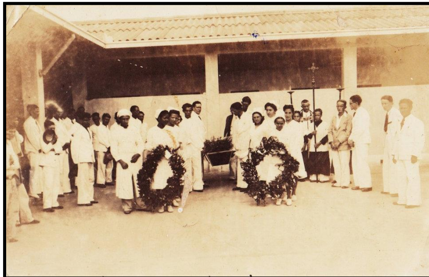
Preparativos para un velorio. Isla de Providencia. Cerca de 1940.