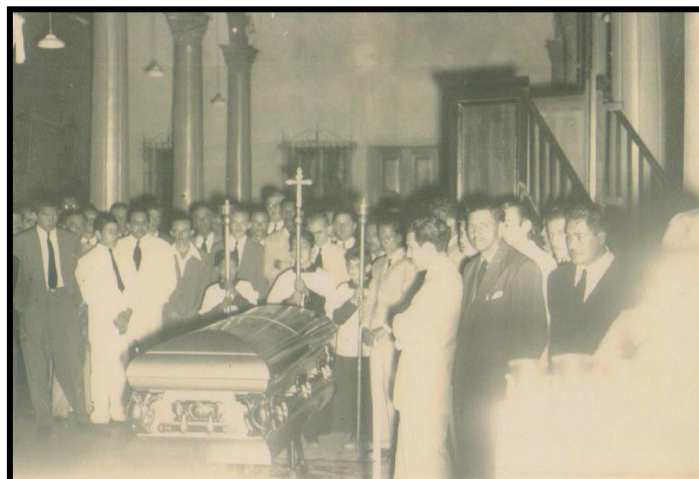
Sepelio en Maracaibo. Cerca de 1950